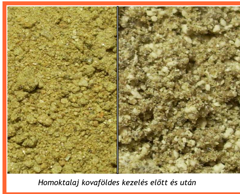
Homoktalaj kovaföldes kezelés előtt és után